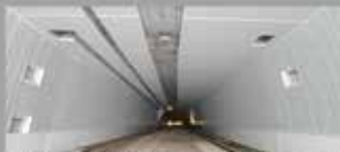
Absorbierende Verkleidung, Tunnel Sins